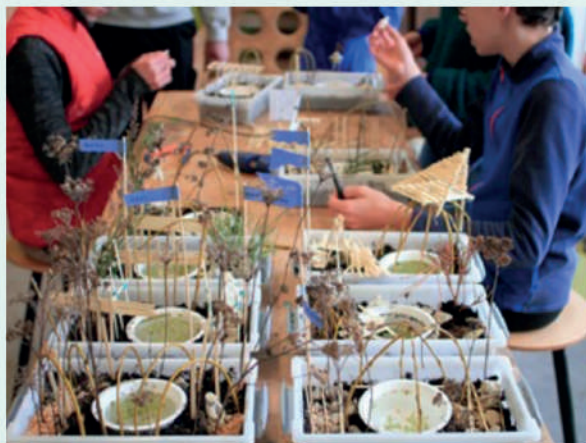
Atelier maquette vivante pour le pourtour d'une mare - IME Soubeyran, St Barthélémy-sous-Grozon (07) - Atelier Bivouac