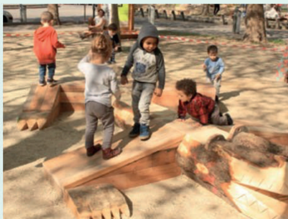
Construction de jeux à partir des troncs de platanes du bois de Vincennes - Rond point de La Chapelle - Paris (75) - Atelier Bivouac