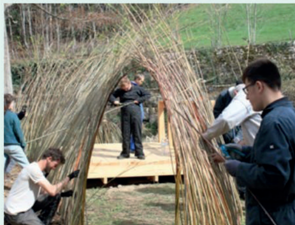
Réalisation d'une cabane en saule vivant avec les enfants de l'IME Soubeyran (07) - Atelier Bivouac -