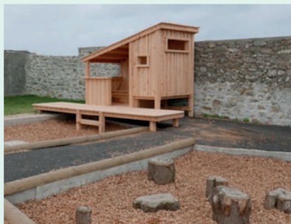
Construction de cabanes dans la cour d'école de Ouessant - (29) - Atelier Bivouac