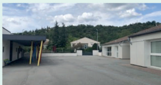
Cour de l'école primaire actuelle vue vers le portail.

• Jouer pour mieux grandir : des espaces ludiques et diversifiés, de parcours et d'aventure pour se dépenser, courir, se cacher, inventer, éveiller la curiosité et l'imaginaire, se retrouver.